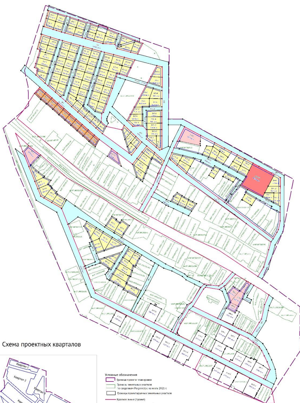
Схема проектных кварталов